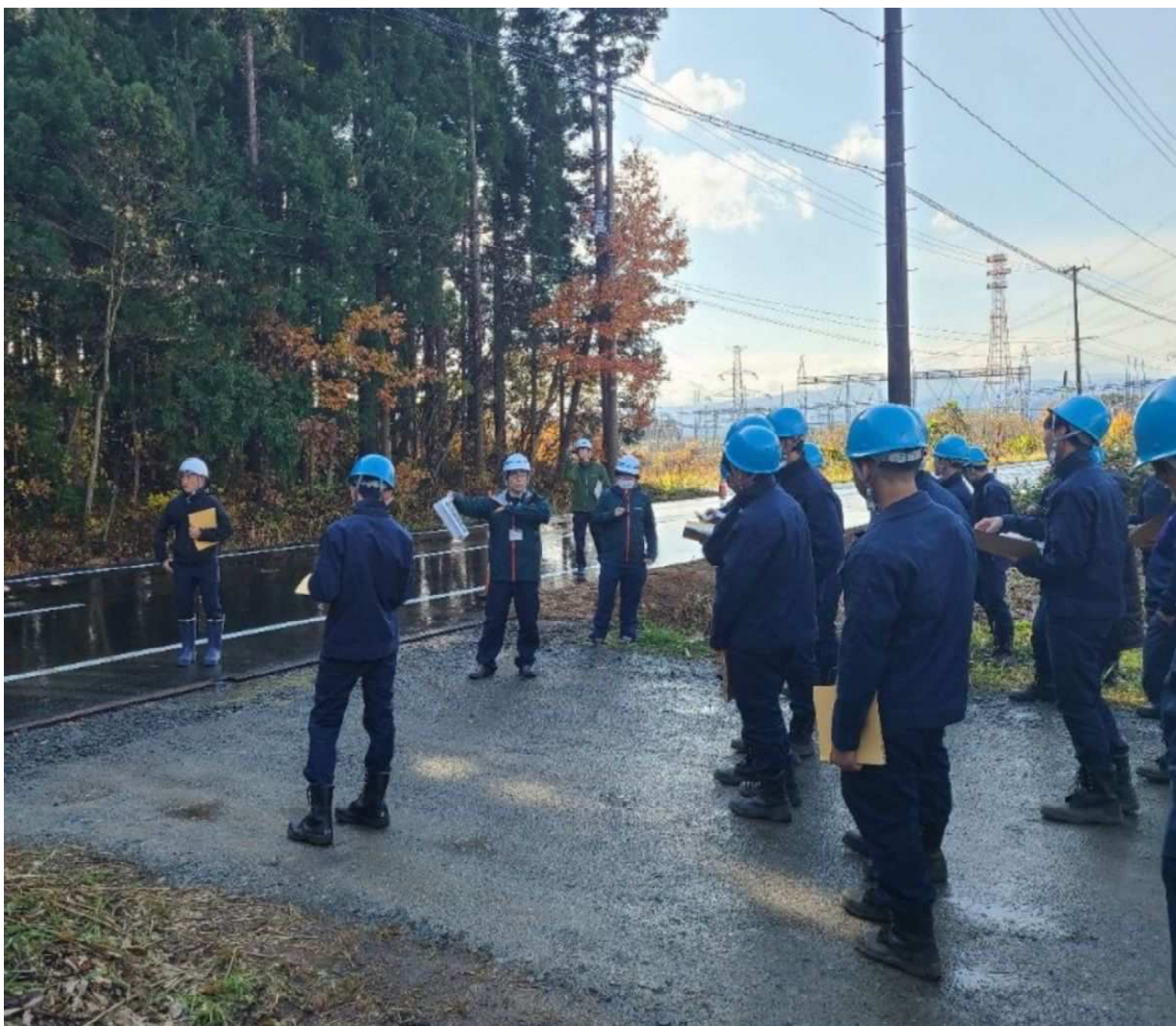
農道整備の現場 中部上北（東北町）

未来の技術者たちが、自分たちの力で 地域や農業を支え、発展させていく姿を 楽しみにしています。