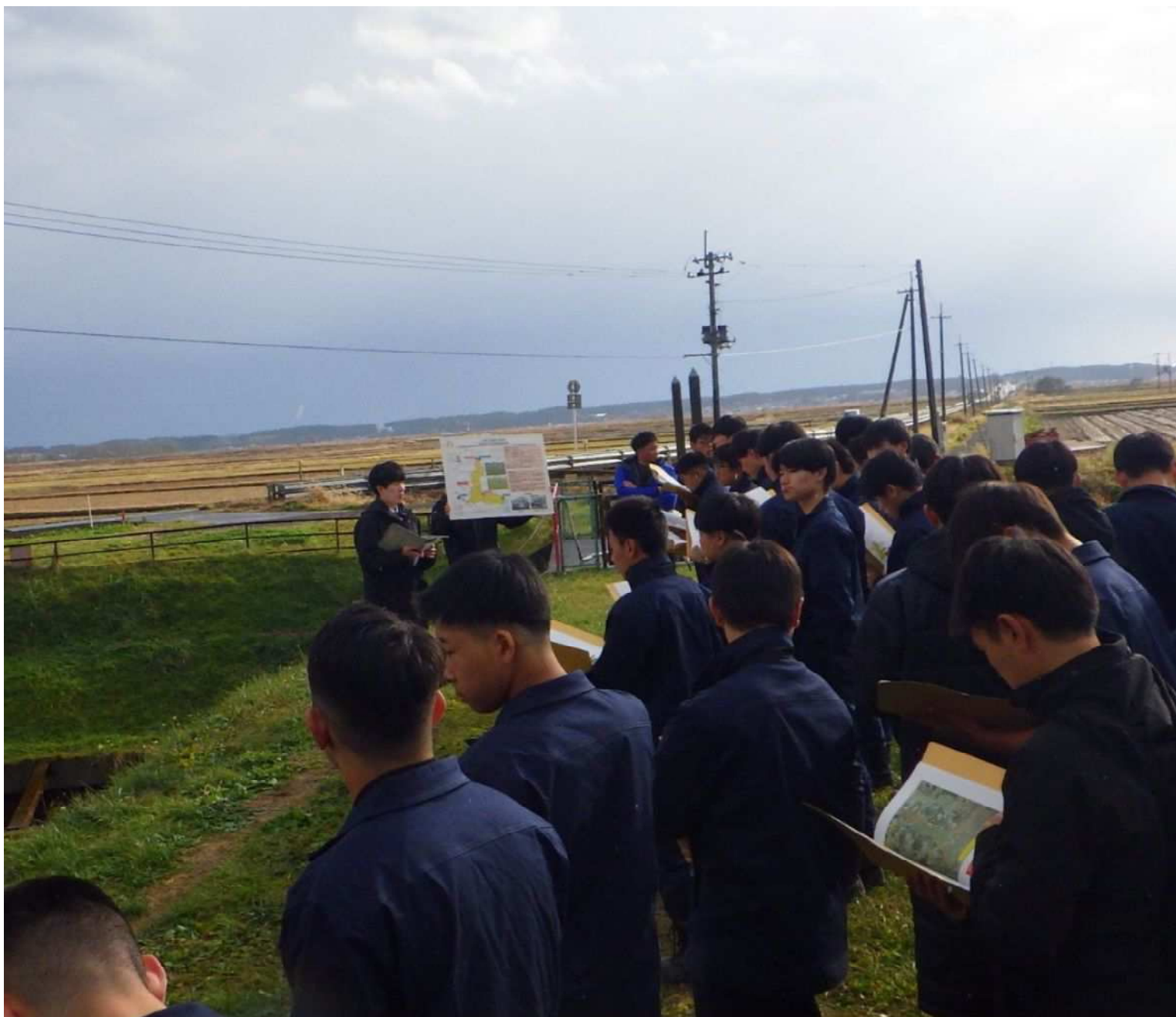
ほ場整備の現場 土場川（東北町）

農業の生産を支える土地改良事業の魅力を若い世代に伝えるため、現場見学会を開催しました。