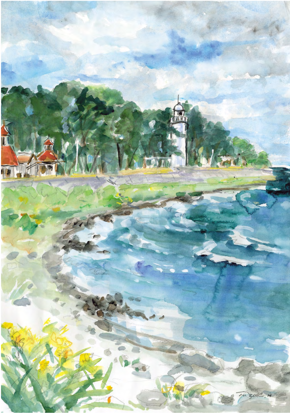
初夏の灯台(平鏡) 張山 田鷗子